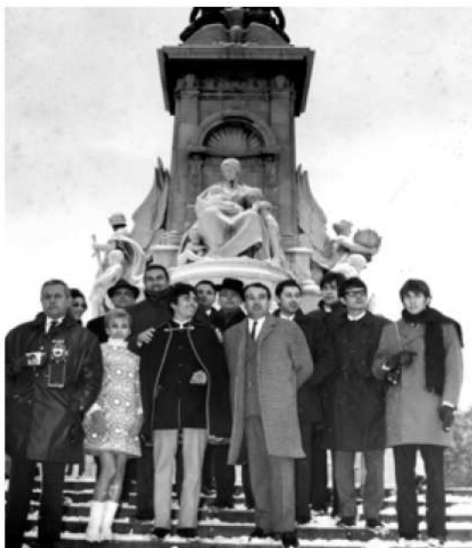
Viatge a Londres amb el grup Los 5 del Este. 1967.