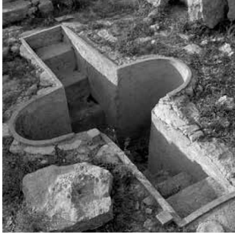
Vista de la pila més antiga.