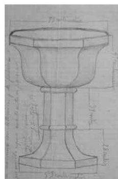
Esbós de la pila.