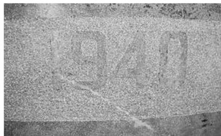
Detall de la data gravada a la pila.