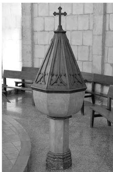
Vista general de la pila.