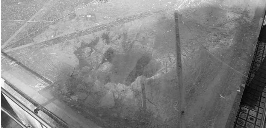
Vista actual de la pila.