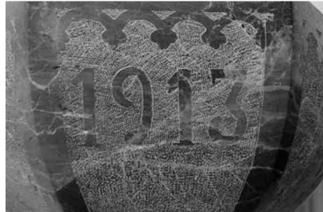
Detall de la data gravada a la pila.

Tapadora: de fusta, sense policromar. Mesures: 100 x 75,5 x 75,5 cm. Està xapada en roure. És de base octogonal coronada per una creu, i s'adapta a la pila. S'obrin tres dels vuit panells. Cada un dels panells té decoració tallada en fusta que imita les decoracions gòtiques dels retaules.