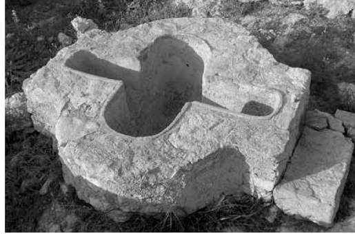
Vista de la pila més moderna.

de 2008, l'estat de conservació de les dues peces és bo.