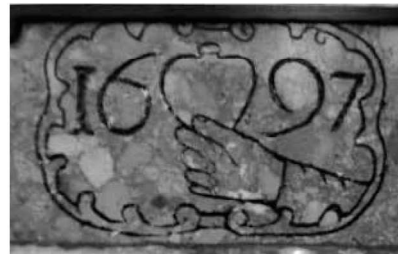
Detall de la data gravada a la pila.

decoració superior escultòrica (anyell pasqual) i amb motius vegetals 1 . La segona, contemporània, de vidre i ferro pintat amb decoració superior 2 .