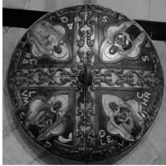
Vista en planta de la tapadora.