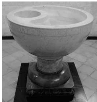
Detall de les piques.

Tapadora: mesures: 45 x 99 x 99 cm. Com en el cas de la pila, la tapadora està dissenyada per Llorenç Bonnín. Està fabricada en fusta, té forma de volta, està dividida en dues meitats i coronada per una peça de fusta decorada amb una creu.