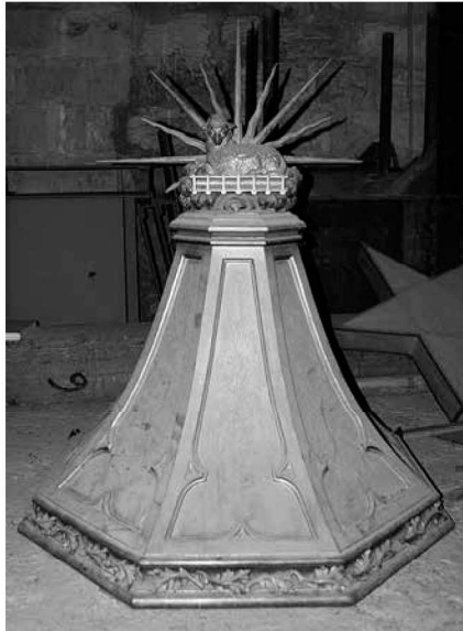
Tapadora antiga de la pila.