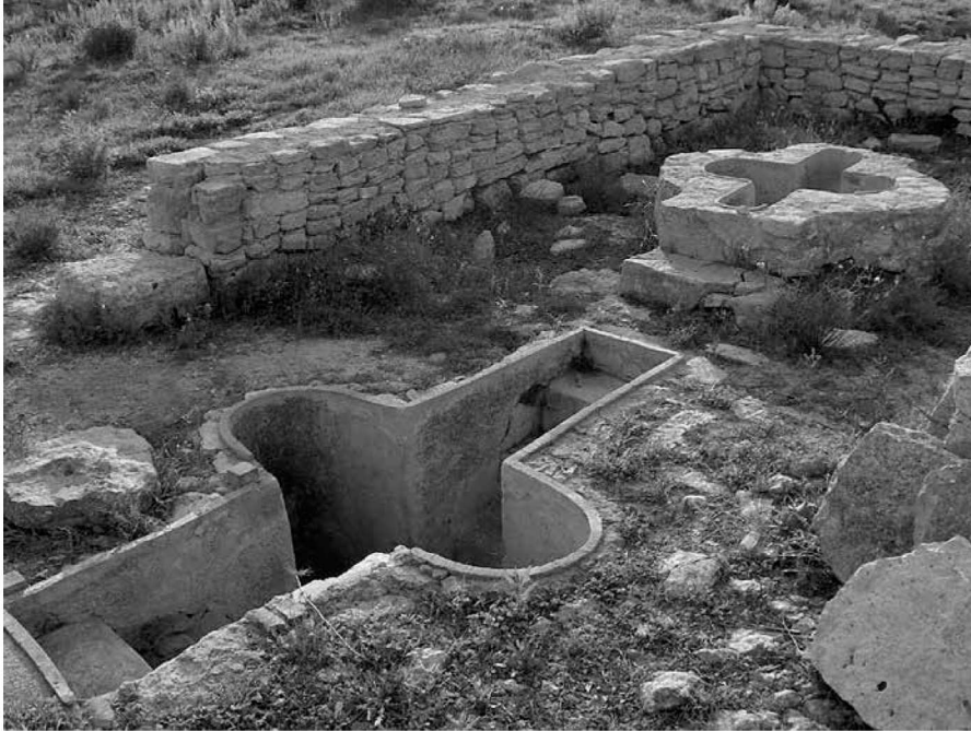
Vista general de les piles.