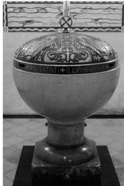
Vista general de la pila.

Inscripcions: hi ha gravada a la pedra de la pila la frase “Descendat + in + hanc + plenitudinem + fontis + virtus + spiritus + sancti” i la imatge de l'Esperit Sant.