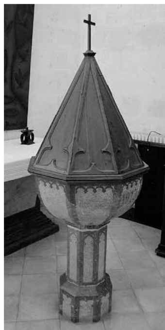
Vista general de la pila.

Descripció: és una pila octogonal (base, fust i pila) amb decoració d'estil gòtic en totes les seves parts. La pila té una separació a la mei-