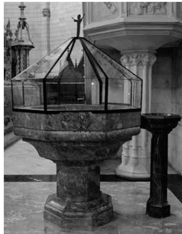
Vista general de la pila.

Tapadora: en té dues. La primera i més antiga (135 x 115 x 115 cm), de fusta amb