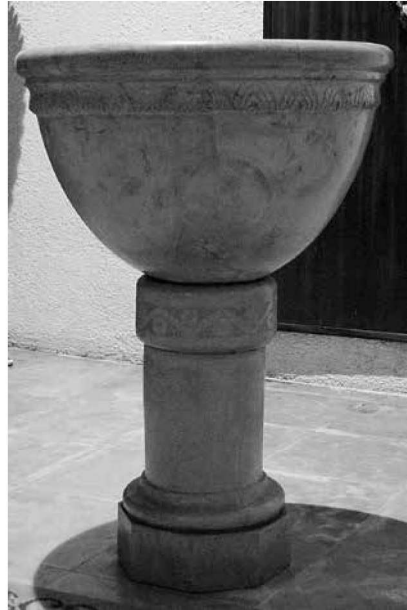
Vista general de la pila.

Intervencions: es veuen a la base de la pila unes marques d'haver estat més enfonsada en el trespol. S'hi ha intervengut, suposam que de manera no profes-