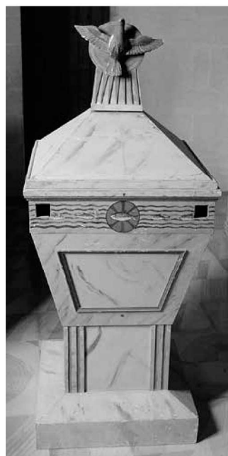
Vista general de la pila.