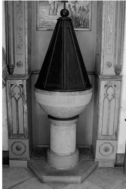
Vista general de la pila.