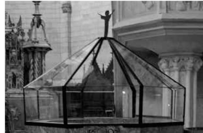
Tapadora actual de la pila.