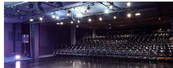
Teatre de Manacor