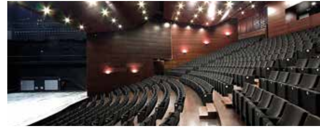
Auditori de Manacor