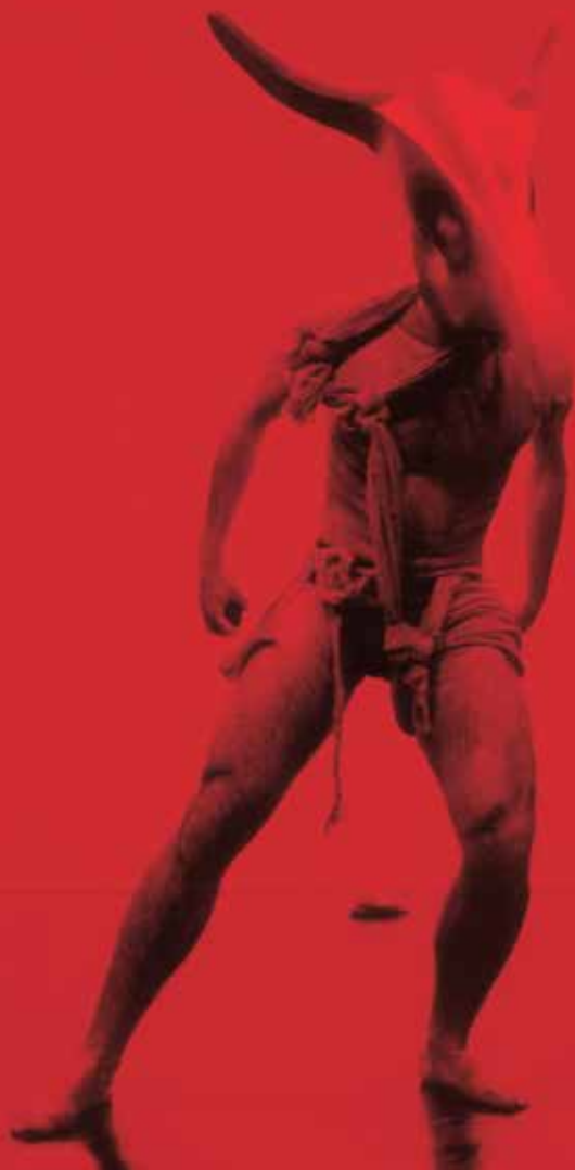
Fotografia portada: L'alegria que passa