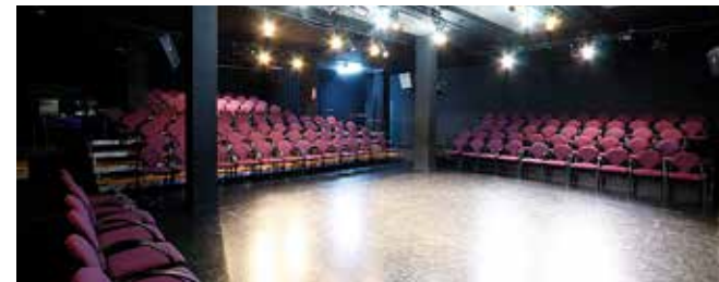
Teatre de Manacor