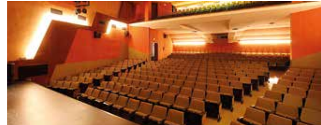
Teatre de Manacor