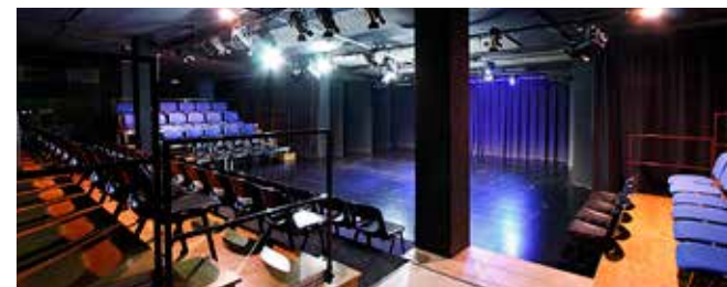
Teatre de Manacor