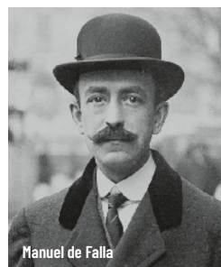
Manuel de Falla

Divendres 29 de setembre - 19.30 h Auditori de Manacor - 18 €