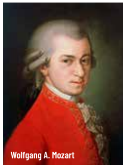
Wolfgang A. Mozart

Divendres 9 de febrer - 19.30 h Auditori de Manacor - 18 €