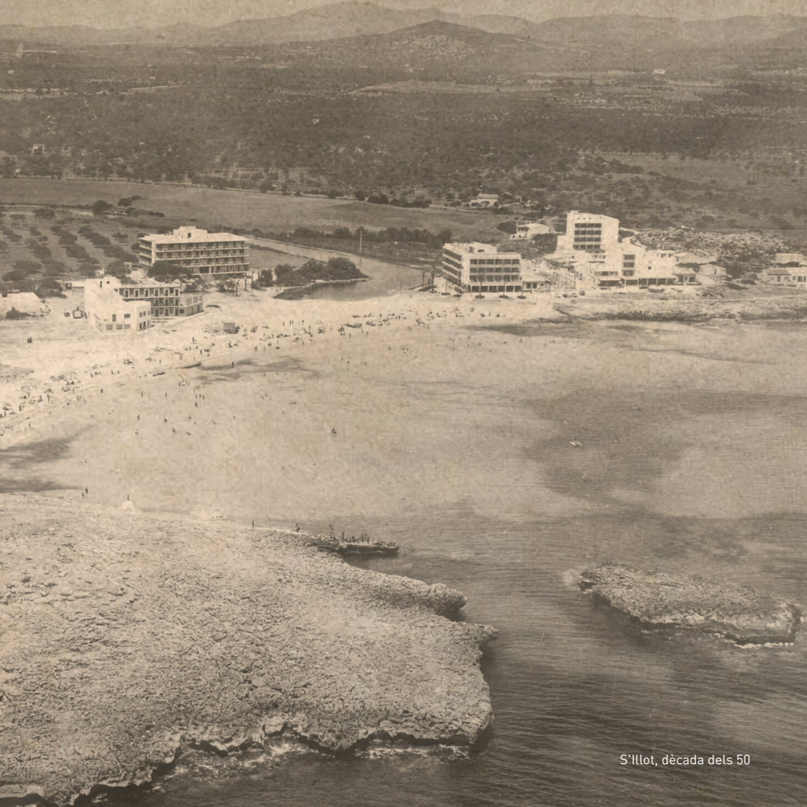
S'Illot, dècada dels 50