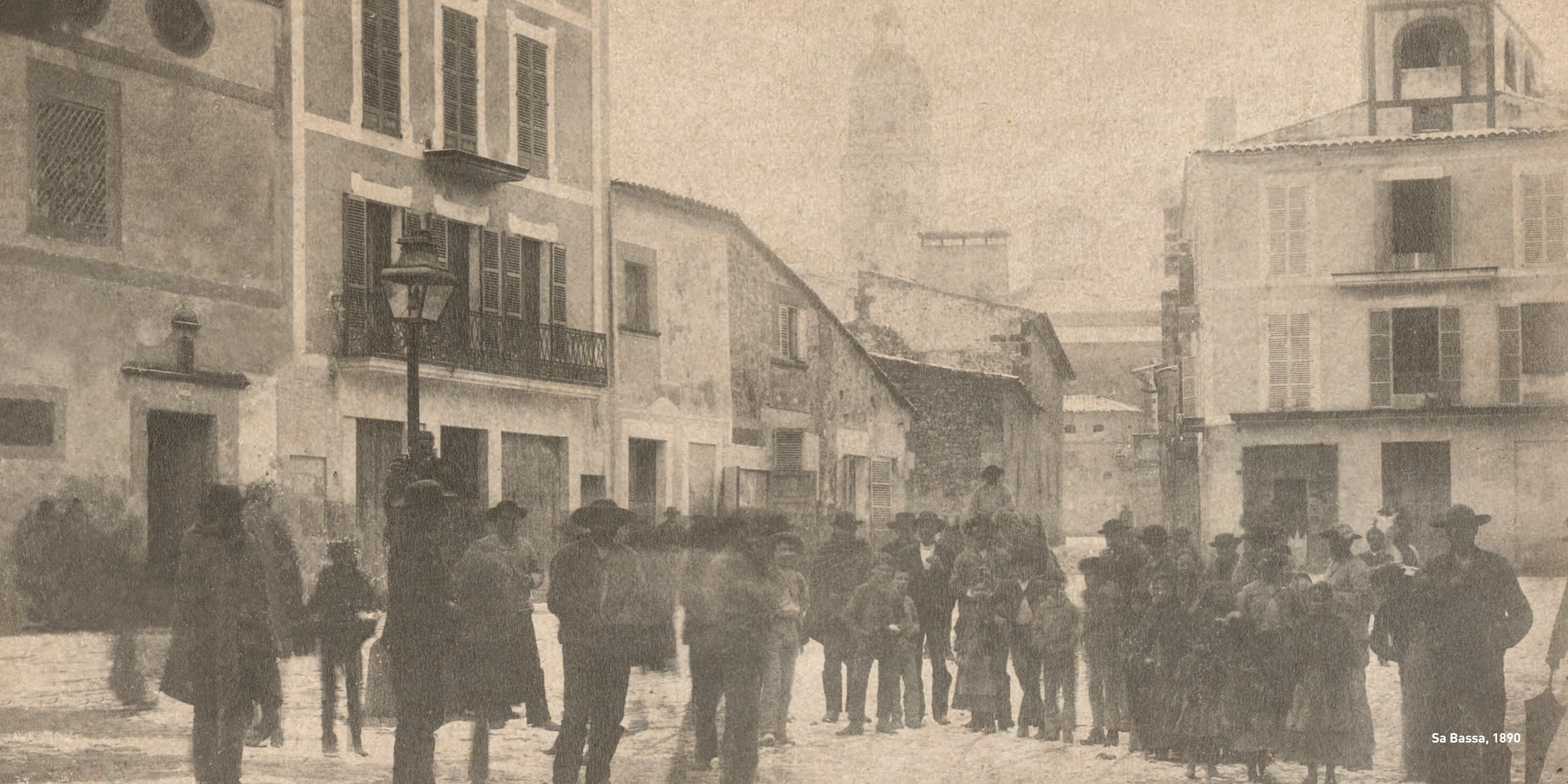
Sa Bassa, 1890