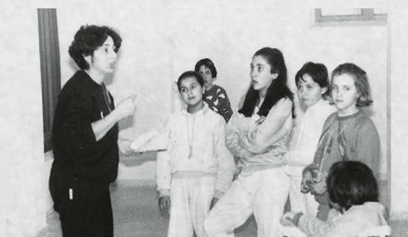
Classe de la Mostra de Teatre Escolar de Francisca Pocoví.

“La Mostra és molt important per als infants o adolescents, que a part d'estimular la creativitat i obrir la ment cap a la cultura, aporta seguretat a l'hora de parlar en públic i estimula el treball memorístic, també es treballa l'autoregulació, gestió emocional, convivència en grup i la responsabilitat”