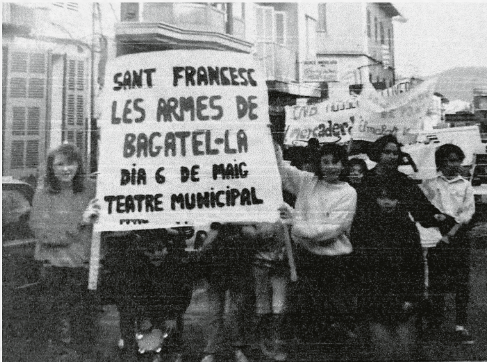
Cercavila de l'any 1987 per anunciar la I Mostra de Teatre Escolar de Manacor.

30 muntatges teatrals · 359 actors i actrius · 9 directors i directores · 13 col·legis i instituts