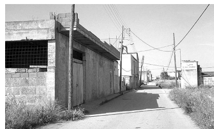
Camí de ses Tapareres