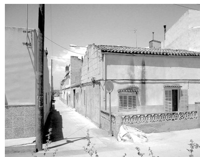
Carrer de l'Ametler