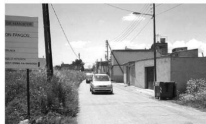
Camí de Son Fangos