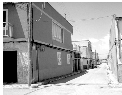
Carrer de l'Olivera