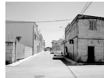
Carrer de l'Hortència