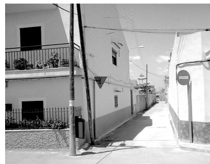
Carrer del Taronger