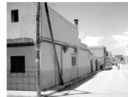
Carrer de la Llimonera