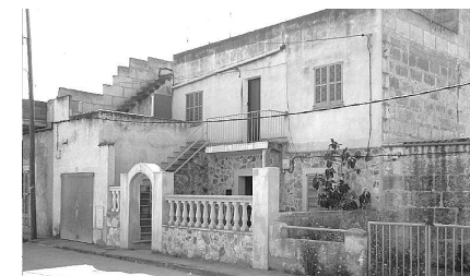
Camí Tapareres, primera casa