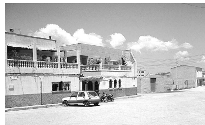
Pl. Pilar i Carrer del Garrover