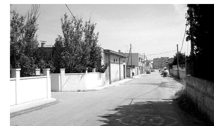
Camí Son Fangos des de s'Hortet