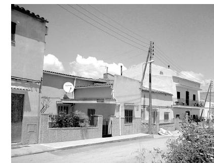
Carrer de Son Fangos. Les tres primeres cases