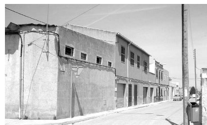
Carrer del Cirerer