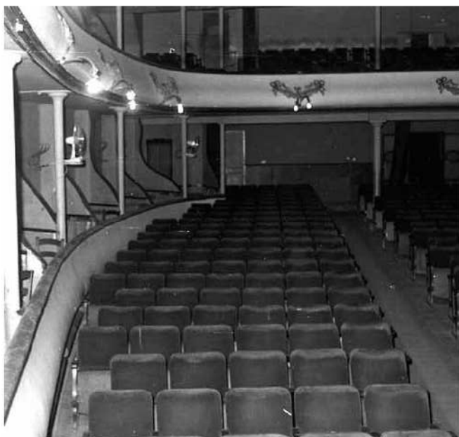
Pati de butaques, llotges i pis superior.

Passada la primera dècada del segle XX, la nostra ciutat experimentà una certa diversificació. Així doncs, l'augment de la població i el creixement del nucli urbà contribuïren a la modificació de la fesomia del poble. Uns anys abans, el 1879, la inauguració de la línia de ferrocarril Sineu-Manacor ja havia donat un impuls important a l'economia, la qual cosa va suposar una millora per a tota la xarxa de comunicació. Un altre esdeveniment que seria crucial per al desenvolupament en tots els àmbits fou l'arribada de l'electricitat el 1902. El foment de la indústria, que a poc a poc havia donat un impuls a l'economia, fa que el 1912 el rei Alfons XIII concedeixi a Manacor el títol de Ciutat. El 1920 el claustre del convent dels dominics és declarat Monument Artístic Nacional. El mateix any es va inaugurar el passeig d'Antoni Maura i el Sr. Josep Oliver Billoch, aleshores batle de Manacor, exposà al consistori la possibilitat de construir un hipòdrom amb el finançament de l'Ajuntament. Un altre fet que cal recordar és l'aparició del primer exemplar del setmanari Manacor el 1921, subtítulat com a Semanario independiente .