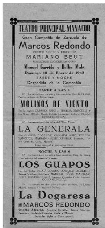
Programa de mà de 1943.