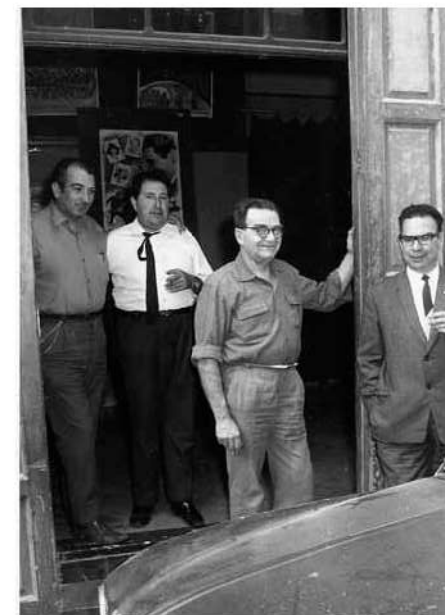
Moments abans de tancar definitivament el Teatre. Arxiu de Perlas y Cuevas.

A l'entrada del teatre es va instal·lar una exposició de programes de mà i fotografies d'obres representades al llarg de gairebé mig segle.