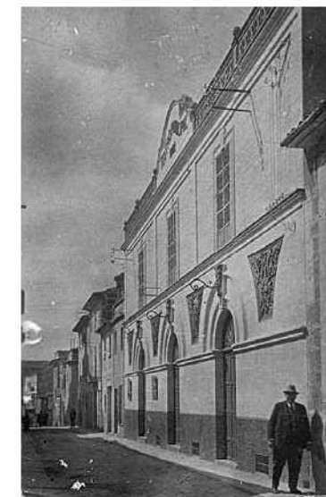
Façana del Teatre Principal.

Un any després de la seva inauguració (1923) i després d'unes petites reformes, el Teatre Principal va obrir de nou les portes amb una nova oferta: la de fer cinema. Aleshores els dos teatres que hi havia a Manacor, el Varietats i el Femenies, ja en feien des de 1906 i 1907 respectivament. Amb el temps, el sèptim art -així l'anomenarien- acabaria exercint un enorme poder d'atracció entre les classes populars.