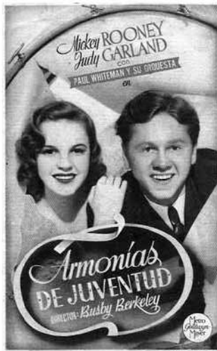
Pasqui dels anys quaranta.

Aquest any es va decretar la prohibició de projectar pel·lícules en cap altre idioma que no fos el castellà. El català és esborrat de la vida cultural de Mallorca i, com era d'esperar, la censura controla el tipus de teatre i de cinema que es pot veure. La majoria d'obres són de tendència costumista, amb trames còmiques i sentimentals. Segurament per raons patriòtiques, abans de sortir d'una funció de cinema o de qualsevol espectacle tots els espectadors s'havien d'aixecar i alçar