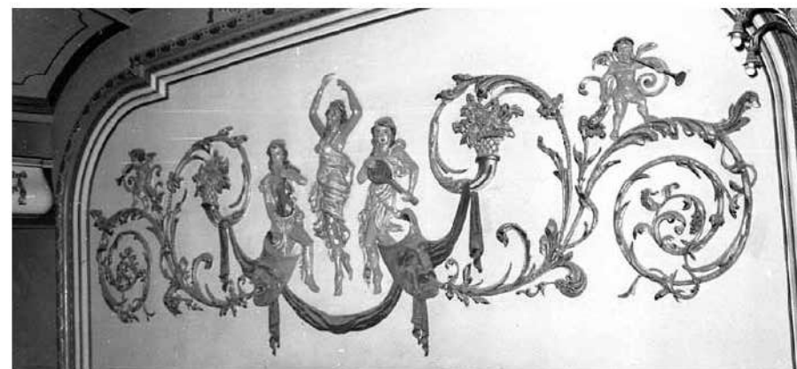
Frontispici de l'escenari.