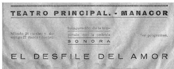
Publicitat de la primera pel·lícula sonora que es va projectar a Manacor.