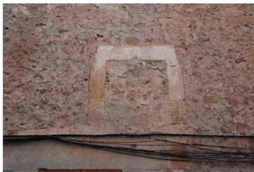
Finestra condemnada al carrer de la Soledat.

Conegut antigament amb el nom de carrer dels Tonedors, i com a mostra de la gran importància que havia tengut antigament, s'hi ubica l'antiga posada dels mínims a Manacor, de la qual encara queden restes com a testimoni: la capelleta dels mínims, amb sant Francesc de Paula i restes de teules pintades.