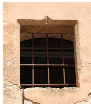
Finestra al carrer Pare Andreu Fernández.

la típica esmotxada conopial. Això, i l'època de construcció del claustre, ens indiquen que aquest portal seria una interpretació dels antics portals del gòtic flamíger.