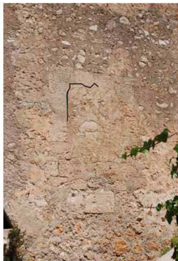
Finestra condemnada a Mendia.

Des de no se sap quan, una finestra conopial ha perdurat condemnada en una de les velles parets de l'edifici. Una vegada superat el portal forà i un corredor cobert, ens trobam a l'ala sud de les cases un celobert on des d'una àmplia carrera