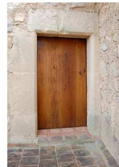
Portal exterior de la Torre dels Enagistes.

En aquesta mateixa planta, a la cambra esquerra, on dormien els senyors, hi ha un petit portal que dona accés a un terrat. A la part exterior, una senzilla incisió en el marès adorna el portal, segurament obert amb molta posterioritat a la construcció de l'edificació, tot i que es va fer seguint el mateix estil artístic que la resta.