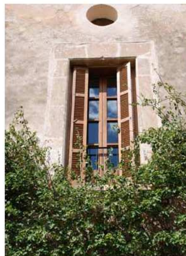
Finestra balconera a sa Vall.