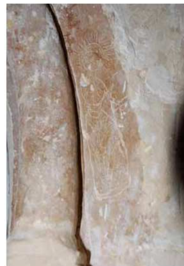
Detall del grafit al portal del carrer Príncep.

Aquest portal conopial, clarament mutilat en una antiga reforma de l'habitatge, va perdre la forma original de l'intradós, ja que el varen reconvertir en un portal rodó. Així mateix es va elevar el terra, motiu pel qual se'n va perdre part de la zona inferior que presentava el típic acabament en forma de bassa de columna. També presenta mutilació el cordó que a manera de motlura recorria el perímetre de l'arc i els petits capitells que marcaven la separació entre els brancals i la llinda, tot i que, de tots aquests elements, encara se'n conserven algunes traces. Igual que molts dels portals analitzats, tot i que la llinda és d'una sola peça, presenta una certa inclinació cap a l'esquerra. La decoració floral que es troba a l'esmotxada de l'arc és molt esquemàtica.