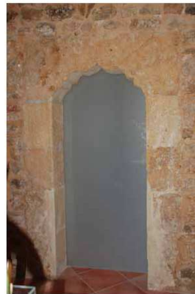
Portal recuperat a les cases de Son Llunes.

Les cases de Son Llunes, que durant segles foren de la família Nadal, es troben en el camí de la vall de la Nou. Al seu interior acullen un dels portals més ben conservats de tots els que hem pogut analitzar. De fet, aquest portal estava condemnat i quan els seus propietaris reformaren la casa per habitar-la es trobaren amb la sorpresa de tenir un portal conopial. Igual que altres arcs analitzats en el present treball, aquest portal no presenta cap tipus de decoració si n'exceptuam les corbes i angles que el conformen. La llinda és d'una sola peça de marès de gran qualitat, motiu pel qual és un dels arcs que es troben en edificacions privades més ben conservats dels que hem pogut observar.