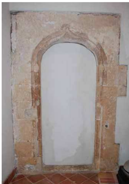
Portal conopial en un habitatge del carrer Príncep.

Un exemple n'és la casa que acull el portal conopial que analitzam en aquest punt. La casa, venuda fa uns anys per tomar-la i fer-hi una nova construcció, fou adquirida per una família que amb molt bon criteri decidí restaurar-la i que es trobà amb l'agradable sorpresa del portal conopial en una de les petites estances. Aquest portal posa de manifest que la casa original havia d'ésser molt més gran del que és avui dia, ja que es trobava paredat en un dels murs amigters amb la casa veïna.