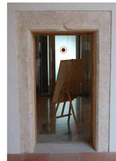
Portal al claustre dels dominics.

A les antigues estances d'aquest convent, ubicades a la planta superior del claustre, s'hi localitza un portal conopial. És un senzill portal allindat que presenta al centre