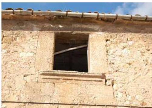
Finestra amb ampit al carrer de Sant Ramon.

Conegut popularment amb el nom de carrer des Santet, per la petita capelleta amb la imatge de sant Ramon, en aquest carrer del barri del Convent hi ha una casa que conserva una finestra allindada amb l'esmotxadura conopial al centre i una elegant motlura a la zona del llindar.