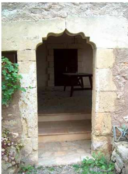
Portal a Son Comte Torre.

es distribueixen les diferents dependències del casal. A mà esquerra hi ha una escala adossada a l'edifici que permet accedir a Can Ribes. 7 Els elements arquitectònics que recullen les parets d'aquest habitatge -entre ells la finestra conopial, el portal apuntat d'entrada, les voltes, etc.-, ens fa pensar que potser aquestes cambres puguin correspondre a l'estança senyorial que tengué el casal. Qui dona nom a l'espai possiblement fos un dels tants senyors que ha tengut la possessió. Sobre aquesta escala es pot veure la finestra conopial localitzada que altre temps donà llum i embellí els citats estatges de la planta superior.