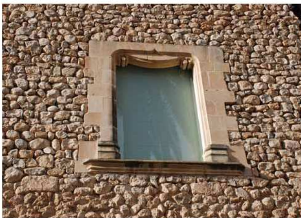
Finestra de la Torre dels Enagistes.

hi havia una finestra conopial situada en aquest indret del casal, aquesta no era exactament com la que hi ha actualment. De fet, pel que es pot intuir en antigues fotografies, la finestra conopial de la Torre dels Enagistes devia ésser una finestra conopial senzilla. A l'interior, aquesta finestra té banquets festejadors.