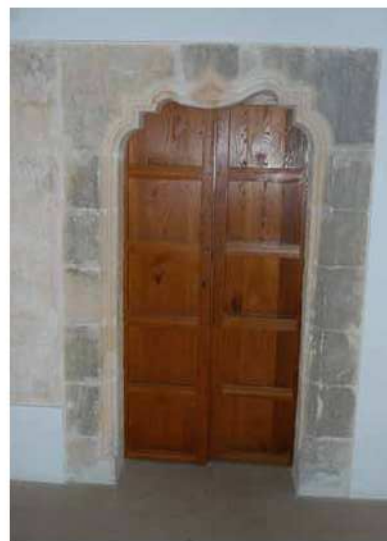
Portal interior a la Torre dels Enagistes.