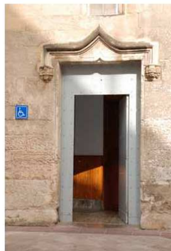
Portals de la Reial Parròquia dels Dolors.

Tal com ja s'ha esmentat en el principi del present treball, la pervivència en el temps de l'estil gòtic fa que s'hagi convertit en l'estil mallorquí per excel·lència. Així, quan a finals del segle XIX es va decidir la construcció d'un nou temple parroquial en substitució de l'antiga església gòtica, coneguda popularment com a Seu Xiqueta , es va optar per l'estil neogòtic. Vitralls, rosasses, arcs apuntats i arcs conopials entre d'altres elements caracteritzen aquesta construcció.