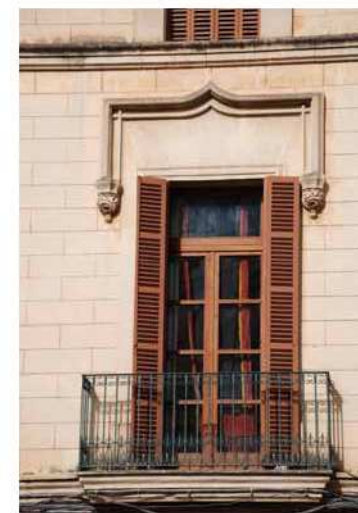
Edifici a la plaça del Palau.