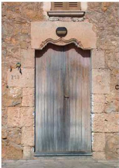
Portal a les cases de Son Colom.

veure que ens trobam davant d'un dels edificis antics de la nostra ruralia. El portal es localitza al fons d'un passadís estret, conegut per gent que habitava les cases per 'es pas fosc', que des de la casa donava accés a una cambra. Aquest estatge, amb el temps reformat, fou emprat com a paller pels darrers estadants que hi visqueren.