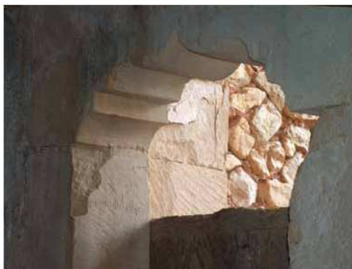
Portal conopial de Tortova vist des dels dos costats.

de cap tipus. El fet de trobar-se en una construcció en ruïnes ha provocat que el mateix moviment de l'edifici hagi comportat la inclinació de l'arc.