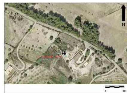
Foto aèria 8 S'Olivar Nou.

s'Olivar Nou (v. foto aèria 8) està ocupat per una construcció de recent edificació i s'Olivar Vell (v. foto aèria 9) per vegetació ruderal, si bé encara trobam evidències físiques de la presència pretèrita d'oliveres.