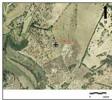
Foto aèria 2. Sa Vinyassa de ses Planes.

Un altre paisatge històric que ens apareix reflectit a la toponímia el trobam també al nord del terme municipal de Sant Llorenç des Cardassar. En concret a la possessió de sa Begura, propietat on una de les cloves du per nom clova de sa Vinya (v. foto aèria 3). És un cultiu desaparegut en aquell paratge, ocupat per arbrat de secà en l'actualitat, però que encara conserva el nom de lloc antic de quan la clova estava ocupada de vinya en un passat on l'extensió del cultiu era molt més