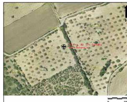
Foto aèria 3. Clova de sa Vinya de sa Begura.

present i, per tant, molt més incident en el paisatge que no ara. La fotografia aèria contigua mostra clares evidències de l'absència de la vitàcia en aquests terrenys, per la qual cosa, com en els casos anteriors, ens trobam davant d'un exemple d'un topònim relict que ens descriu un paisatge històric. Sense deixar de banda el terme municipal de Sant Llorenç des Cardassar, hi trobam un altre exemple situat al sector meridional del terme (àrea de Son Evinent). En un establert d'aquesta finca mare, Can Moià, hi trobam un sementer anomenat sa Vinyassa , on tampoc a dia d'avui no trobam indicis del cultiu vitícola (v. foto aèria 4).