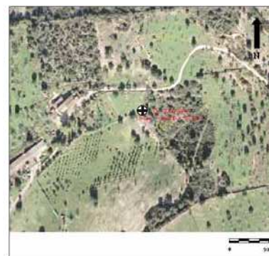
Foto aèria 5. Sa Vinyeta de son Carrió Vell.

El darrer cas que hem trobat de topònim fòssil, el trobam a l'antiga possessió de Son Carrió Vell, on segons la toponímia tenim constància d'una vinyeta avui en dia desapareguda (v. foto aèria 5).