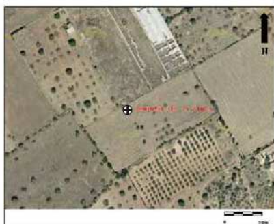
Foto aèria 1. Antic sementer de sa Vinya de Son Tovell.

Un cas similar a l'anterior el trobam al nord del terme municipal de Sant Llorenç des Cardassar: el topònim de sa Vinyassa dona nom a un indret de la possessió de ses Planes, al·ludint a la presència d'una vinya de grans dimensions. Cultiu, aquest darrer, absent en aquell paratge a dia d'avui (v. foto aèria 2).