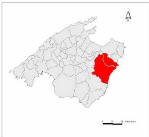
Mapa 1. L'àrea d'estudi.

L'àrea d'estudi correspon als termes municipals de Manacor i Sant Llorenç des Cardassar (municipi que va pertànyer a Manacor fins al 1892). Es tracta d'un territori d'uns 340 km 2 poblat per uns 46.000 habitants (vegeu mapa 1).