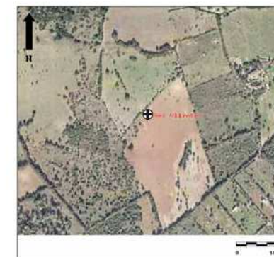
Foto aèria 10. Ses Oliveres de Can Duai.

Dins el terme municipal de Sant Llorenç des Cardassar trobam un altre nom de lloc que evidencia l'antiga presència d'oliveres. Es tracta en concret d'un paratge de la finca de Can Duai (situat a l'extrem oriental) anomenat ses Oliveres . A dia d'avui, tal com podem observar en la següent fotografia (v. foto aèria 10), aquest indret està totalment mancat d'aquest cultiu, però sembla, tal com ens ho indica la fitotoponímia, que en altre temps en tengué.