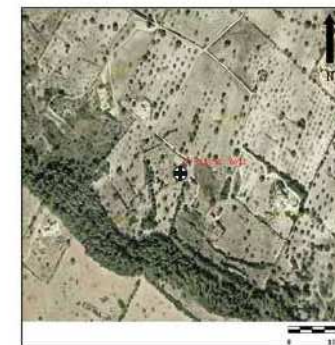
Foto aèria 9. S'Olivar Vell.

Dins el terme municipal de Sant Llorenç des Cardassar trobam un altre nom de lloc que evidencia l'antiga presència d'oliveres. Es tracta en concret d'un paratge de la finca de Can Duai (situat a l'extrem oriental) anomenat ses Oliveres . A dia d'avui, tal com podem observar en la següent fotografia (v. foto aèria 10), aquest indret està totalment mancat d'aquest cultiu, però sembla, tal com ens ho indica la fitotoponímia, que en altre temps en tengué.