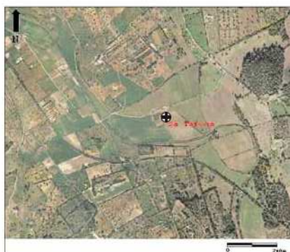
Foto aèria 12. Localització de sa Tafona.