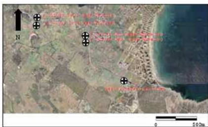
Foto aèria 6. Els antics olivars litorals del terme de Sant Llorenç des Cardassar.

Llevant) (RULLÁN SALAMANCA 2002). Amb tot, amb la crisi agrària dels anys 60 els olivars foren de cada vegada menors i anaren desapareixent, si bé en l'actualitat l'alta demanda d'oli i el fenomen del postproductivisme 2 n'han fet impulsar el cultiu. A l'igual que la vinya, són freqüents els casos en què la fitotoponímia ens ofereix clars exemples de noms de lloc fossilitzats. Tot seguit en mencionam alguns exemples.