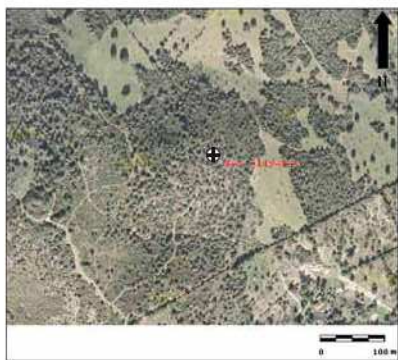
Foto aèria 11. Ses Oliveres de Cas Canonge.

En l'actualitat, el cultiu de l'olivera en aquest espai és pràcticament inexistent i les úniques oliveres presents són de plantació moderna.