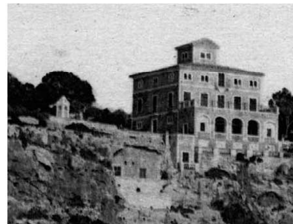
El casal de Cas Correu a Porto Cristo amb la cova de Santa Elena.