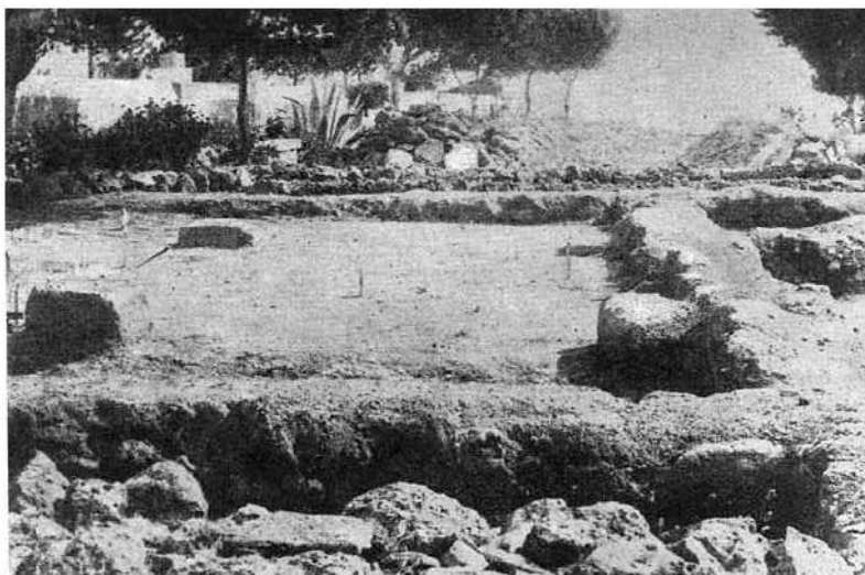
Restes de la basilica de sa Carrotja.