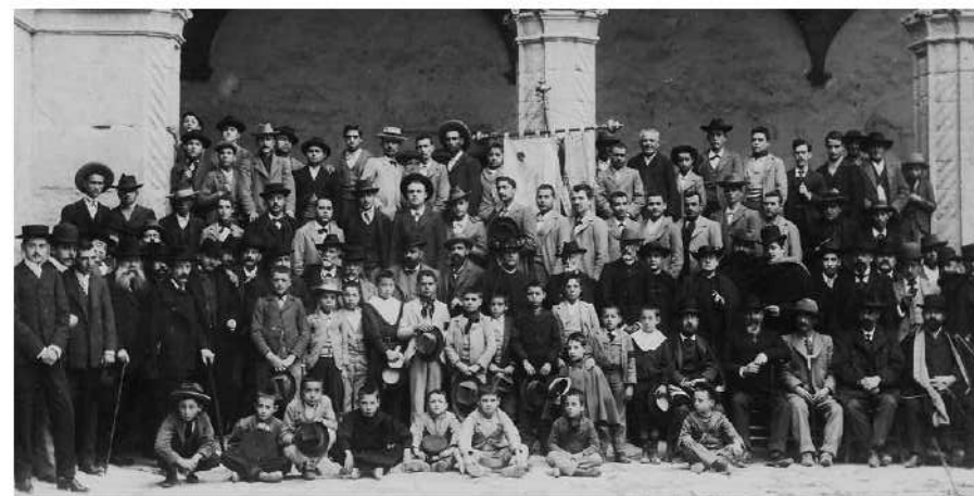
Sa Capella de Manacor el 1902.