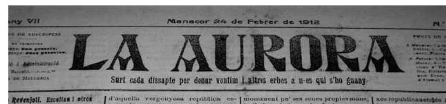
Capçalera de La Aurora del 1912

Pel que fa a la seu social del setmanari durant l'any 1912, l'administració i la redacció són al carrer General Barceló 1r, 2n, de Palma de Mallorca, i s'imprimeix a Palma. L'impressor és Tipografia Litografia de Amengual y Muntaner. Aquests impressors es fan càrrec de la publicació a partir del número 224, de dia 31 de desembre de l'any 1910, que coincideix amb el primer número editat íntegrament en català. Els números de l'any 1912 tenen 4 pàgines de 43,5x30 cm estructurades en quatre columnes de 33x7 cm.