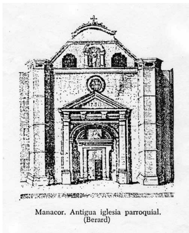
Dues torres antigues adossades al campanar nou.

forma una creu llatina; entre elles: capella dels Goigs, capella de la Puríssima, capella de l'Esperança, capella vella del Sant Crist, etc. De l'església vella queden les mides de l'amplària de la nau llarga i les dues capelles adjacents o veïnes a l'altar major vell, que avui estan dedicades a sant Antoni de Viana i a sant Francesc d'Assís, que no es tiraren a baix. També queden les dues torres de la façana antiga, gòtiques de l'església vella, que aguanten el nou absis adjacent al nou campanar, que es diu torre Rubí; són un record. Si haguessin fet el meu gust, haguessin deixat el vell absis i el vell campanar, que eren obra del rei de Mallorca Jaume II, però la nau principal hauria quedat curta. El poble col·laborà amb jornals i transports, sempre faltaren doblers, que es recolliren de donatius del poble i dels devots al Sant Crist. Falta una història de la construcció i una història també de les imatges dels retaules i altres, antics i moderns, que enriqueixen el temple.