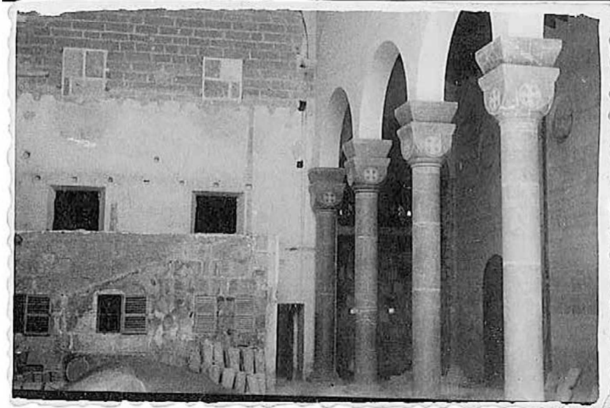
Fotografia de la construcció de Crist Rei, on encara es poden observar les restes del convent i de la paret lateral de St. Roc.

mestre Sebastià Planisi. 58 Dia 6 de desembre hi ha documentada la reparació de les canals.