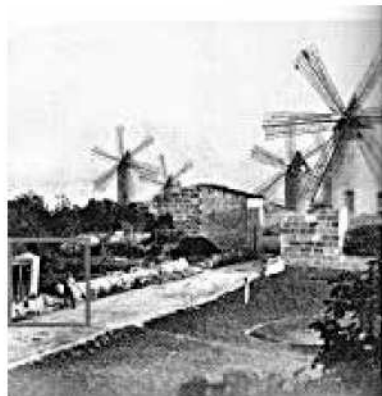
Control al camí de la torre dels Enagistes, a Fartàritx